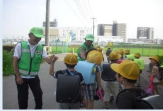
地域の方の見守り