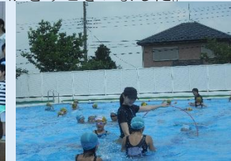
ボランティアさんとプール学習