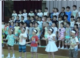
音楽朝会 2年生の発表

7月の音楽朝会は1学期の成果を披露できました。「たぬきのたいこ」「はしの上で」等2年生らしいメドレーの演奏でした。また、プールの学習では楽しく安全に学習できました。夏休み中のプールには教育ボランティアさんのご協力をいただきました。サマースクール等、登下校において安全のご配慮をいただきありがとうございます。