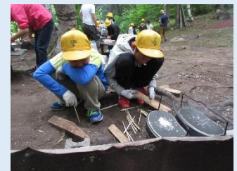
飯ごう炊さんの体験

3日間天候に恵まれ、計画通りの活動ができました。一人一人が活動の見通しをもち、お互いに声をかけ合って充実した林間学校になりました。ご家庭の皆さんの準備や健康管理に感謝申し上げます。