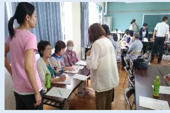
ボランティア会議