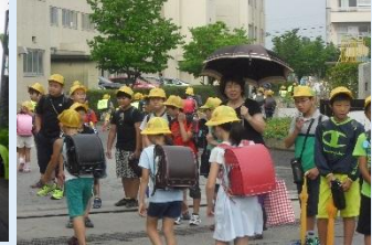
社会を明るくする運動