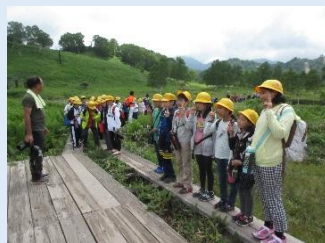
田ノ原湿原のハイキング