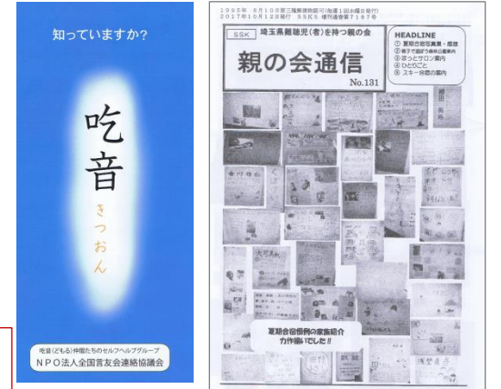
埼玉県難聴児(者)を持つ親の会