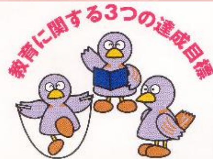
「学力」「規律ある態度」「体力」の基礎・基本