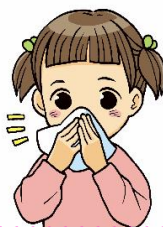
かたほうずつ やさしく

時々、鼻水をズブッと吸っている人を見かけます。鼻と耳はつなが っているため耳の病気になることがありますよ。また、周りの人を いやな気持ちにさせるかもしれません。鼻水は吸わずにティッシュを 使ってかんでください。「片方ずつ」「優しく」かみましょうね。